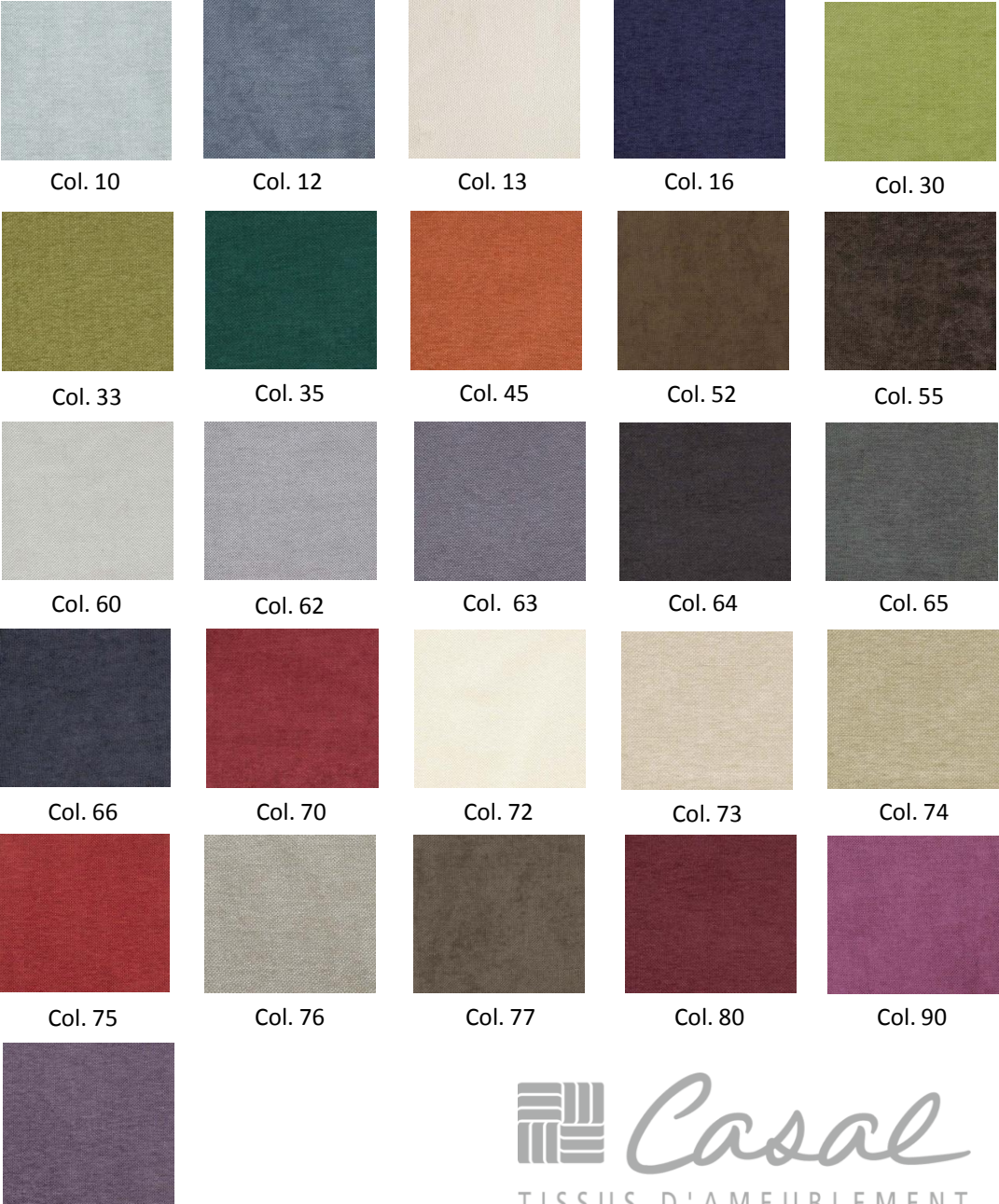
Col. 10 Col. 12 Col. 13 Col. 16 Col. 30 Col. 33 Col. 35 Col. 45 Col. 52 Col. 55 Col. 60 Col. 62 Col. 63 Col. 64 Col. 65 Col. 66 Col. 70 Col. 72 Col. 73 Col. 74 Col. 75 Col. 76 Col. 77 Col. 80 Col. 90 Col. 96